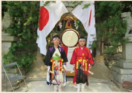
中洲地区太鼓打ち