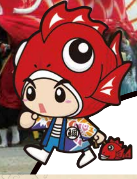
豊浜鯛まつり マスコットキャラクター 祭鯛之介 (まつり たいのすけ)

愛知豊浜「天下の奇祭」鯛まつり 開催日 / 平成29年 7月22日(土)・23日(日) 2017 ※中洲地区「大鯛」は7月23日(日)のみ