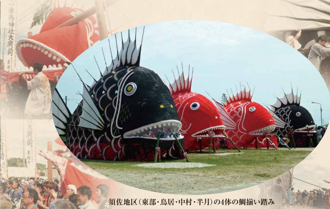
須佐地区(東部・鳥居・中村・半月)の4体の鯛揃い踏み