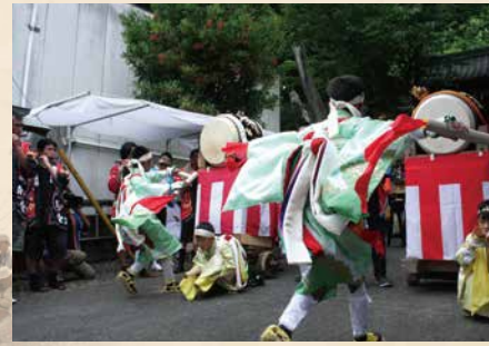
須佐地区太鼓打ち